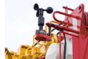
▲ 風速計 (オプション)