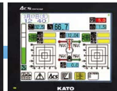
▲ ターゲットモード 何度も同じ位置に品物を吊り降ろす場合に便利。