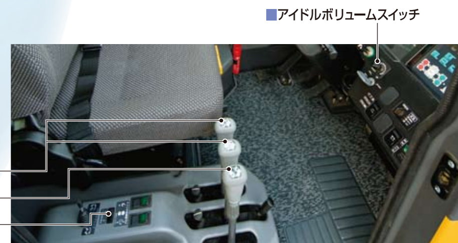
■ アイドルボリュームスイッチ