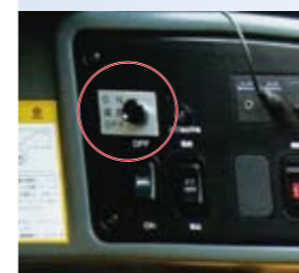
▲ ACS外部音声警報装置 (オプション)