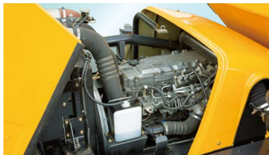
▲メンテナンス性を考慮したレイアウトのエンジンルーム。さらに、エンジンフードのデザインも一新。