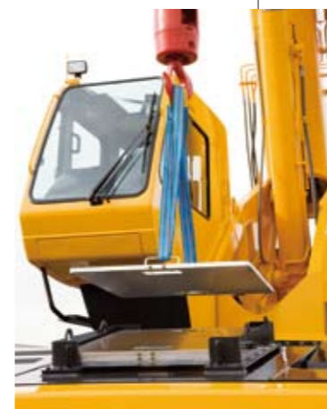
◀ アルミ製敷板を標準装備 (800×800mm)