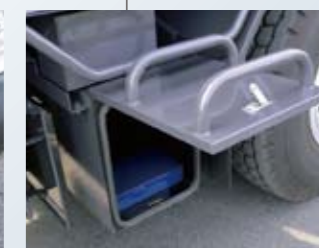
▲ 車両工具箱 (右)