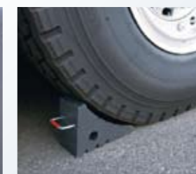
▲ 車輪止め (オプション)