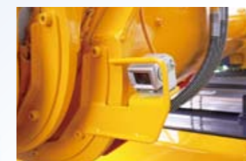
▲ 前方直前確認カメラ