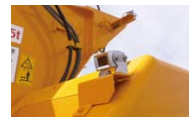
▲ 左前方確認カメラ