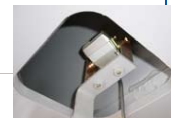
▲ ウインチ確認カメラ (オプション)