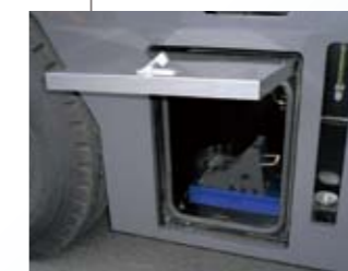
▲ 車両工具箱 (左)