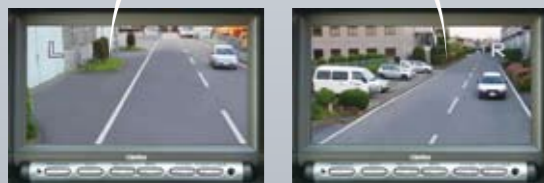
▲ 左方画面 ▲ 右方画面 (オプション)