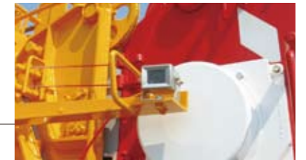
●右方確認カメラ (オプション)