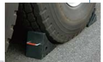
●車輪止め (オプション)