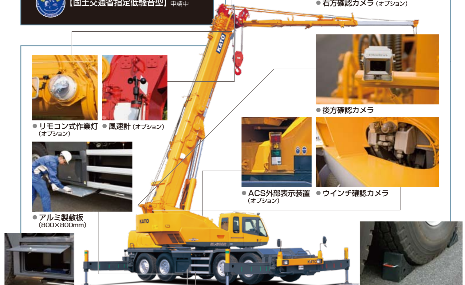
●アルミ製サイドステップ