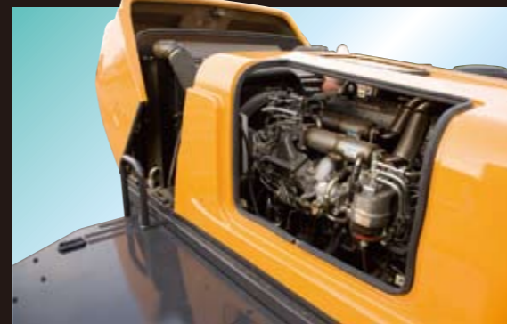
メンテナンス性を考慮したエンジンルーム

噴射圧力と噴射時期の制御自由度が高く、最適な燃料噴射を可能にします。省エネ+振動の少ない静かなエンジンです。