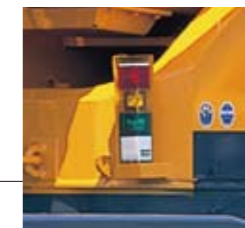
●ACS外部表示装置 (オプション)