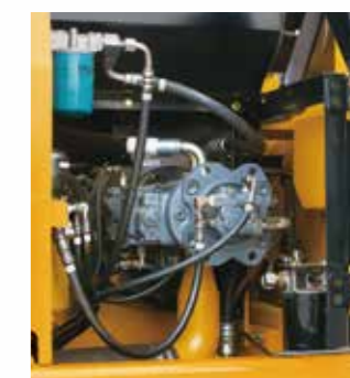
▲メンテナンスの容易なフィルタ配置