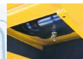
▲ドレンコック (初回点検時装着)