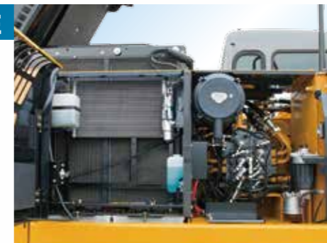
▲清掃を手軽にしたコア並列型ラジエータ